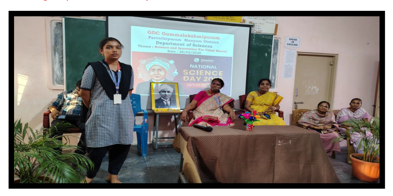
Students highlighted the latest advancements in Science and Technology